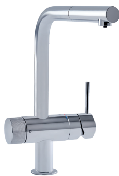
VERSION LOFT (avec mousseur extractible)