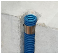
STOP-RING - vue en coupe